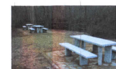
AREA SOSTA SAN GIORGIO