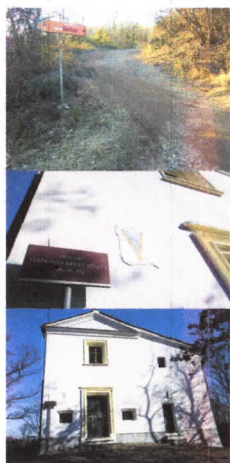
MADONNA DEGLI ANGELI