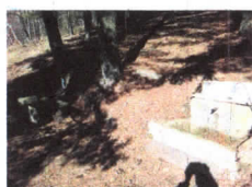
AREA SOSTA IL LAGHETTO